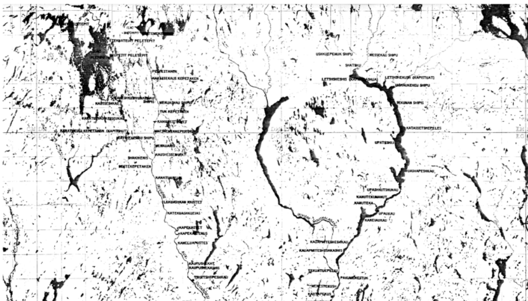
Figure 2 : Secteur du lac-réservoir Manicouagan avant l'enneigement

La gestion du territoire des Monts Uapishka est axée sur la conservation et le respect de l'environnement. Des initiatives de développement durable sont mises en place pour assurer la protection de cette région unique, tout en permettant aux visiteurs de découvrir ses merveilles dans le respect de la nature.